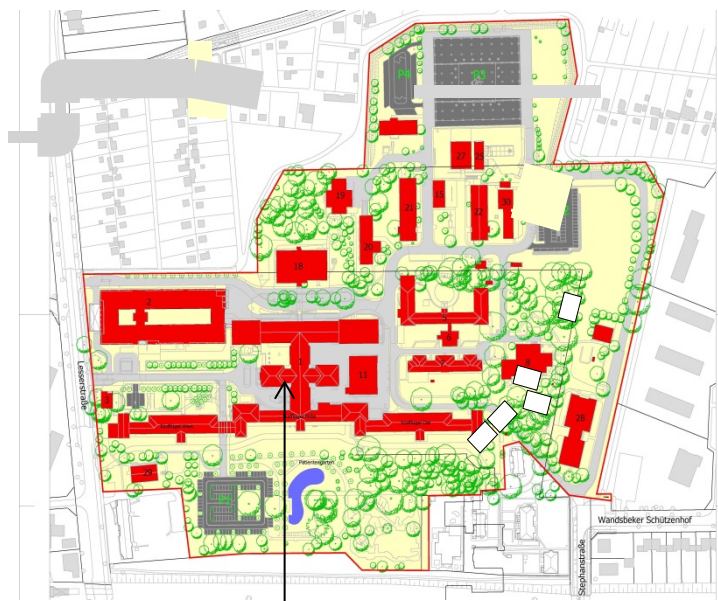
Gebäude 1 Aula 1.OG