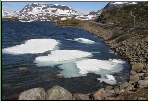
Neues vom Schatzmeister Dezember 2009