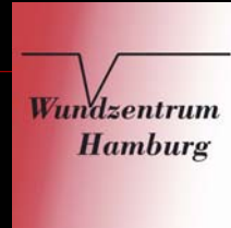
Neues vom Schatzmeister Dezember 2009