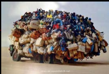
Neues vom Schatzmeister Dezember 2009