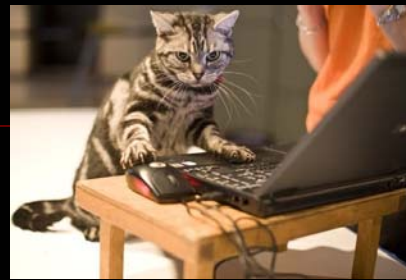
Neues vom Schatzmeister Dezember 2009